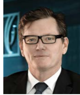
شاين نيلسون الرئيس التنفيذي لمجموعة بنك الإمارات دبي الوطني