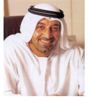
سمو الشيخ أحمد بن سعيد آل مكتوم رئيس مجلس إدارة مجموعة بنك الإمارات دبي الوطني